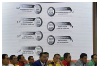
Hasil Lengkap Perolehan Kursi DPR 2019-2024