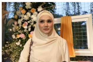
Kursi DPR untuk Mulan Jameela yang Singkirkan Dua Kader Gerindra...