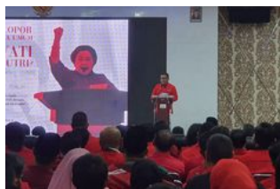
Sekjen PDI-P Ungkap Protes Zulkifli Hasan Saat PAN Tak Dapat Kursi DPR di Jateng